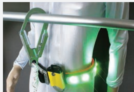
■腰パッドタイプ 胴ベルト安全帯装着イメージ ※1丁掛け・2丁掛けにも対応